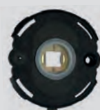
Hochwertige Nylon Unterkonstruktion mit Hochhaltefeder