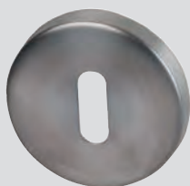
Rosetten mit Ø 55 mm